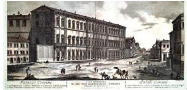
Palazzo Corsini in una incisione di J. Barbault (1763).