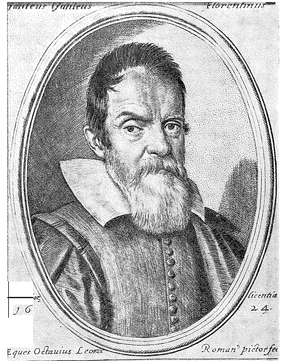
Galileo a 60 anni

Il Sant'Uffizio, investito della questione, accolse, per bocca del cardinal Bellarmino, le riserve espresse dai due padri sulle conce-