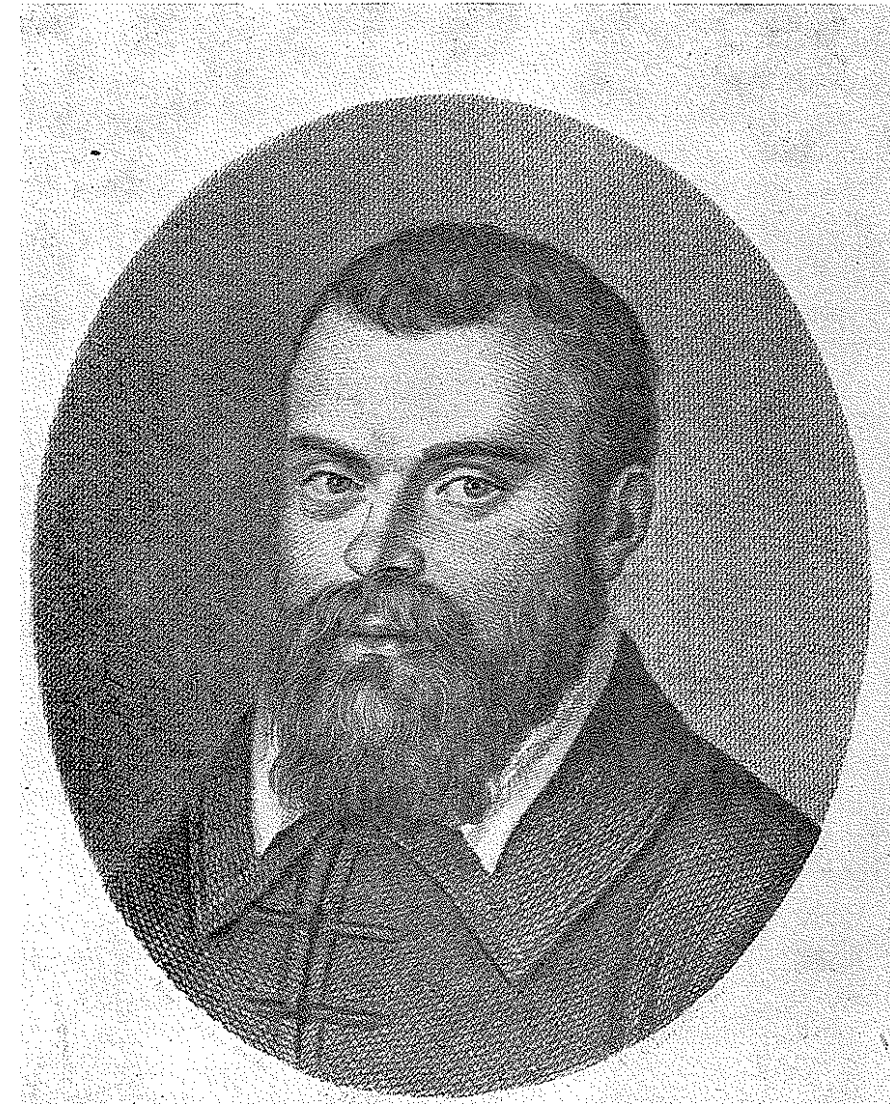
Incisione di Felice Schiavoni dal ritratto di Domenico Tintoretto

Galileo fu iscritto all'Accademia nell'aprile del 1611, dopo aver partecipato con gli amici lincei a una famosa « cena filosofica sul Gianicolo, a S. Pancrazio ». nella quale par quasi di cogliere lo spirito del Convito platonico. Da quel momento Galileo fu al centro della compagnia lincea, riconosciuto quasi come capo di fatto, ammirato, consultato, ossequiato da tutti, tenuto in particolarissima considerazione dallo stesso principe, che intrattenne col Galileo, per tutto il resto della sua vita, una corrispondenza nutritissima, per domandargli consiglio in tutte le questioni che interessavano l'Acca-