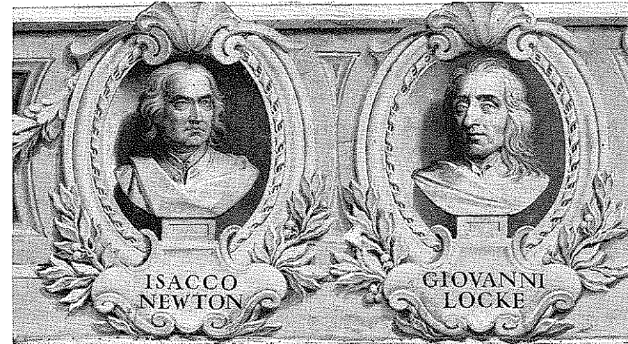
Dal fregio esistente nella Biblioteca Accademica