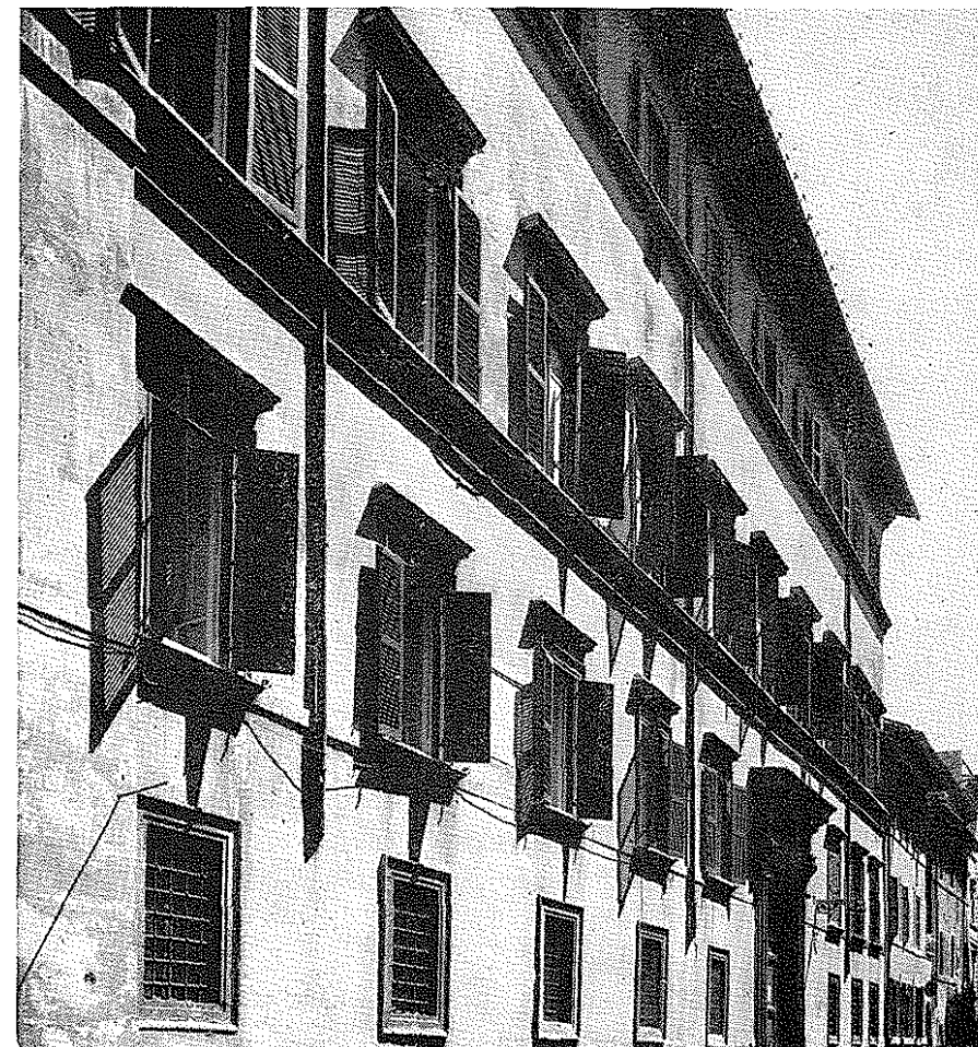
ROMA. Il palazzo Cesi in via della Maschera d'Oro (situato nel Rione Ponte, tra p. Fiammetta e p. Lancellotti) prima sede dell'Accademia di Federico Cesi.

A dettare le norme della « lincealità » (che oltre alle leggi, costituzioni e statuti dei Lincei, dovevano indicare anche il « modo di viver dei Lincei e tutte le loro azioni di governo e cautele »), il prin-