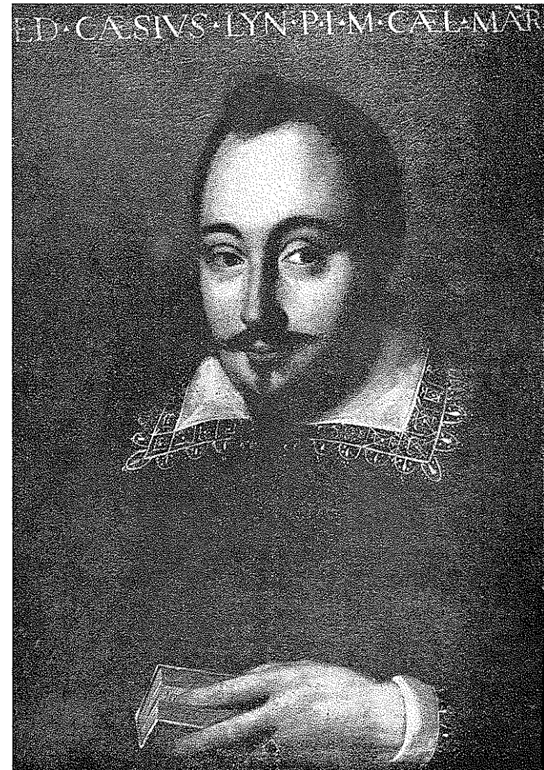
Ritratto di Federico Cesi

Virginio Cesarini, che fu letterato e poeta, cugino, amico e collega di Federico Cesi, ascritto all'Accademia nel 1618, ed uno dei più fervidi fautori degli ideali lincei, così esponeva i principi della sua fede lincea: «... libertà dell'ingegno (cioè dello spirito), amore della verità, confessione dell'ignoranza; vere fonti della scienza