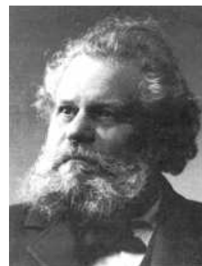
G. Carducci (1835-1907) Socio dal 1887 al 1907 Premio Nobel per la Letteratura nel 1906

Siamo consapevoli che le nostre segnalazioni spesso non trovano rispondenza nel conferimento del Premio, ma questo a nostro avviso non toglie nulla alla nostra convinzione di