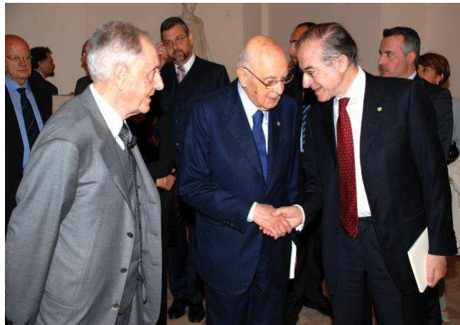
Giorgio Napolitano, Presidente della Repubblica, con Lamberto Maffei e Alberto Quadrio Curzio nella sede dell'Accademia dei Lincei il 18/5/2011

Con l'adunanza del 16 giugno si conclude anche il momento, di competenza della Classe, di formulazione e approvazione delle proposte di cooptazione di nuovi soci corrispondenti e di nuovi soci nazionali. La votazione per le definitive cooptazioni avverrà tra tutti i soci nazionali per corrispondenza. Tutti ci auguriamo che le proposte e le scelte siano al massimo livello e che i nuovi soci si identifichino con l'Accademia dei Lincei che deve contribuire all'incivilimento dell'Italia in Europa e dell'Europa alla luce di ideali e di storia, di sapere e di cultura, ma anche di sobrietà e di iniziativa per il bene comune.