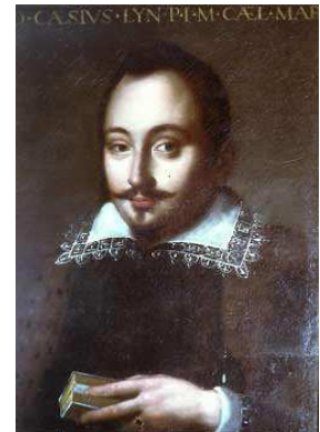
Federico Cesi Fondatore dei Lincei (1585–1630)

Dell'Accademia dei Lincei fu nominato socio ordinario nel 1875 e poi vice presidente fino al 1884. Da Quintino Sella gli venne affidato il compito di tenere a battesimo e di assumere la guida della neo costituita "Classe delle Scienze morali, storiche e filologiche" nel corso di una solenne adunanza tenuta in Campidoglio – sede dell'Accademia – il 19 dicembre 1875 con un pubblico discorso sull' "atto solenne e pieno di alta significazione...di affratellare tutti gli studi in questa veneranda ed eterna metropoli della nazione italiana" 1 . Nessuno più del Mamiani avrebbe potuto, del resto, acquisire il diritto di vedersi attribuito un ruolo così importante, dato che proprio lui, in qualità di Ministro della Pubblica Istruzione, aveva presentato già dal 12 giugno 1860 un progetto di legge per l'allargamento della antica Società italiana delle scienze, ripensata nella forma di Istituto nazionale italiano di scienze e di