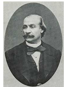
Terenzio Mamiani Della Rovere (1799-1885) Presidente della Classe e Vice Presidente dell'Accademia dal 1874 al 1884