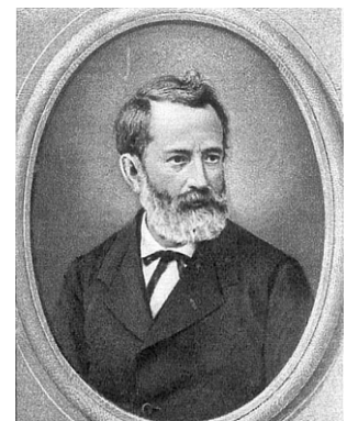
Quintino Sella (1827 - 1884) Presidente dal 1874 al 1884 della Reale Accademia dei Lincei

Il Consiglio di Presidenza ha deliberato la costituzione di un Comitato d'onore per dare adeguato rilievo all'evento con il coinvolgimento delle più alte Istituzioni. Tale Comitato sarà presieduto dal Presidente Carlo Azeglio Ciampi (che è anche presidente onorario degli amici dei Lincei) e avrà tra i suoi componenti Giuliano Amato (Presidente del Comitato dei Garanti per le celebrazioni del 150°