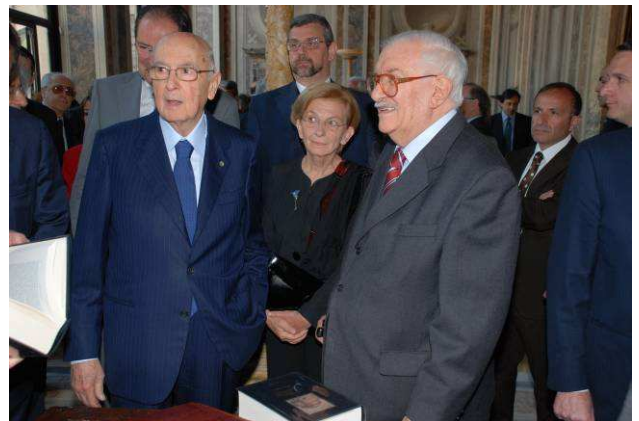
Giorgio Napolitano, Presidente della Repubblica, con Giuseppe Galasso nella sede dell'Accademia dei Lincei il 18/5/2011