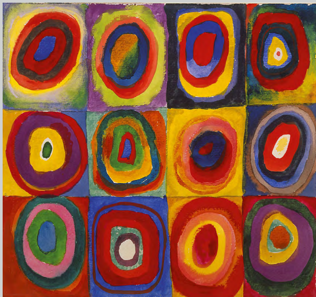
Farbstudie Quadrate, Wassily Kandinsky, 1913 – A distinct and unique transcriptional program, expressed by tumor-associated macrophage (Biswas et al, Blood 2006).

“Immunità e vaccini, dal cancro al COVID-19”