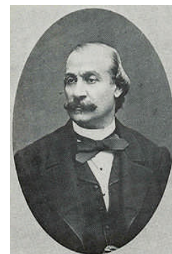
Terenzio Mamiani della Rovere (1799-1885) Presidente della Classe e Vice Presidente dell'Accademia dal 1874 al 1884

A Terenzio Mamiani della Rovere, primo Presidente della nostra Classe, dal 1874 al 1884, ci ripromettiamo di dedicare un convegno nel triennio entrante. Egli occupa un posto di rilievo nella storia del Risorgimento italiano anche per la posizione centrale attribuita alla cultura, intesa quale elemento di propulsione del processo della unificazione nazionale. Un intendimento che ancor oggi mantiene una grande attualità.