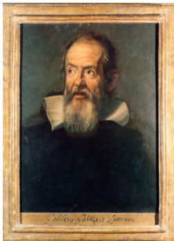
Galileo Galilei Socio Linceo dal 1611 (1564-1642)

Alla fine di ogni anno accademico ho elaborato un consuntivo. Il "Consuntivo dell'attività svolta nell'a.a. 2009-2010" è stato presentato alla Classe il 24 giugno 2010 e il "Consuntivo dell'attività svolta nell'a.a. 2010-2011" è stato presentato il 16 giugno 2011. Infine il 22 giugno 2012 ho presentato il consuntivo 2011-2012 e quello triennale 2009-2012. Ho poi proseguito presentando il consuntivo 2012-2013 il 21 giugno 2013, quello 2013-2014 il 26 giugno 2014 ed infine quello 2014-2015 in uno con quello triennale 2012-2015 oggi.