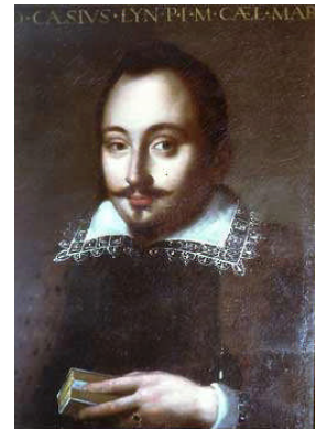
Federico Cesi Fondatore dei Lincei (1585-1630)

Questi consuntivi sono stati poi inviati a tutti i colleghi della Classe e resi disponibili sul sito della Accademia 1 stessa trovando in molti Soci consonanza, manifestata con scritti graditi anche per i suggerimenti. Per la presente relazione saranno anche importanti i contributi dei Soci per eventuali integrazioni e per completamenti se vi sono state delle omissioni (per altro possibili, data la densa attività svolta ai Lincei nel triennio accademico concluso) di cui terremo conto per una definitiva riedizione, prima della pubblicazione nei Rendiconti.