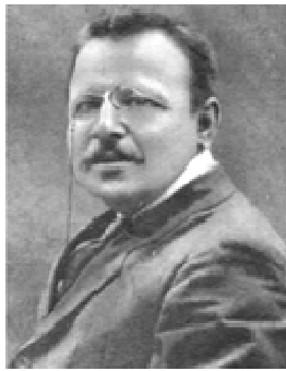
Benedetto Croce (1866-1952). Socio dal 1923 al 1935 e dal 1945 al 1952 e Presidente del Comitato per la ricostituzione dell'Accademia dei Lincei nel 1945-46

Nel consuntivo 2009-2012 avevo anche espresso il desiderio di promuovere altri due convegni su personalità della nostra Classe che subito dopo la fine della seconda guerra mondiale molto hanno contribuito alla rifondazione della nostra Accademia: Benedetto Croce e Luigi Einaudi. Sappiamo che su queste personalità sono stati fatti molti convegni, ma noi crediamo sia utile una riflessione con una impostazione simile a quella utilizzata per Quintino Sella, che faremo qui iniziando da Luigi Einaudi del quale ho avuto modo di interessarmi molto in breve nei passati consuntivi (1) e che i Lincei hanno ricordato nel Convegno “Luigi Einaudi: Istituzioni, Mercato e Riforma Sociale” tenutosi qui in Accademia il 18-19 febbraio 2004 ed organizzato con il contributo della Banca d'Italia, dell'Ente Einaudi di Roma e della Fondazione Einaudi di Torino (2) .