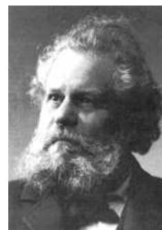
G. Carducci (1835-1907) Socio dal 1887 al 1907. Premio Nobel per la Letteratura nel 1906.