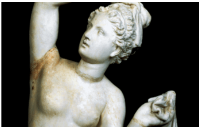
Statua di Afrodite, Roma, Museo Nazionale Romano, Palazzo Altemps.